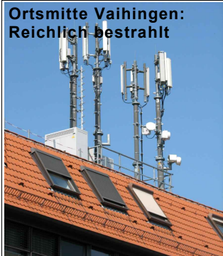
Ortsmitte Vaihingen: Reichlich bestrahlt

tungen speziell der Umweltmedizin an die Verantwortlichen in Gesundheitswesen und Politik sowie die Öffentlichkeit. Wir beobachten in den letzten Jahren bei unseren Patienten einen dramatischen Anstieg schwerer und chronischer Erkrankungen. Da uns Wohnumfeld und Gewohnheiten unserer Patienten bekannt sind, sehen wir immer häufiger einen deutlichen zeitlichen und räumlichen Zusammenhang zwischen dem Auftreten dieser Erkrankungen und dem Beginn einer Funkbelastung. Wir können nicht mehr an ein rein zufälliges Zusammentreffen glauben. Aufgrund unserer täglichen Erfahrungen halten wir die 1992 eingeführte und inzwischen flächendeckende Mobilfunktechnologie und die seit 1995 käuflichen Schnurlostelefone nach DECT-Standard für einen der wesentlichen Auslöser dieser fatalen Entwicklung.“